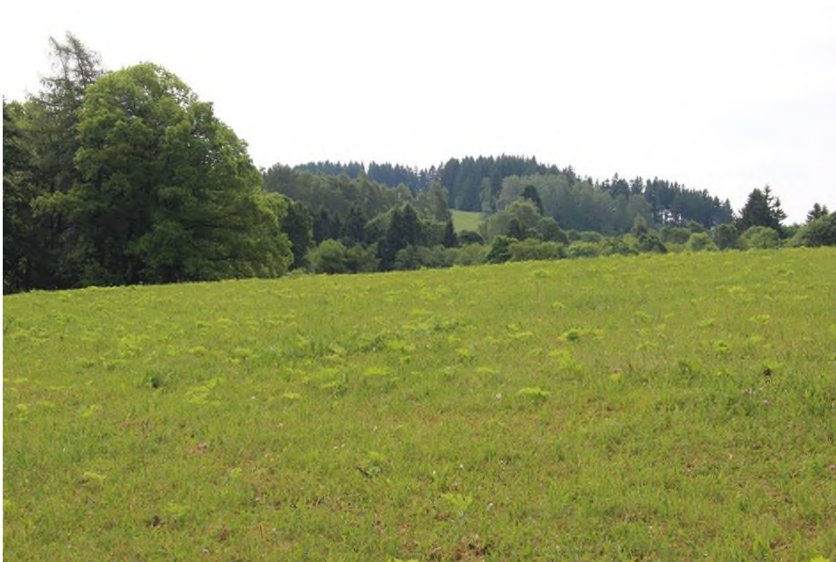
pokud na ploše nejsou ve velké míře semenáče, jedná se o střední pokryvnost